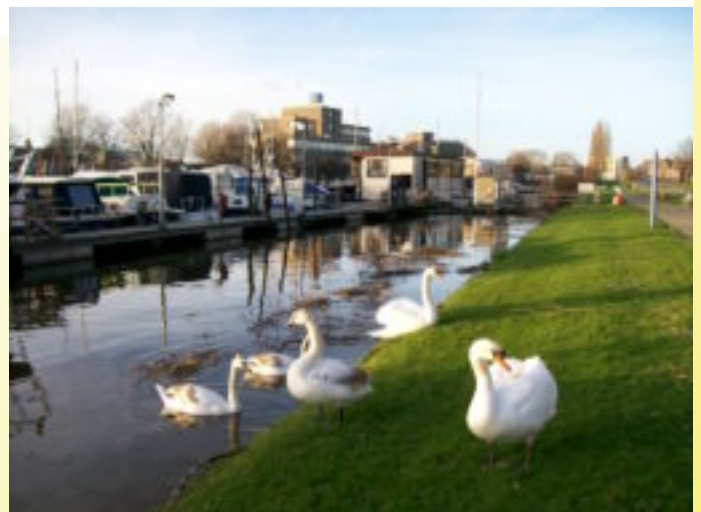
Hoewel er soms nog een koude wind staat, is het toch wel duidelijk dat de lente eraan zit te komen.