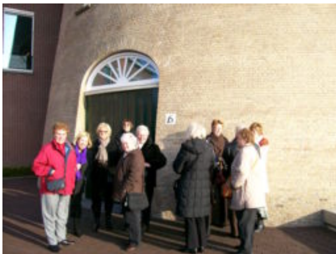
De schippersvrouwen van de Nieuwe Waterweg gaan een bezoekje brengen aan de Molen van NOL ET. Tevens wordt destilleerderij bezocht, hierdoor worden zij opgenomen in het Gilde van de Jeneverdrinkers

Het gaat mij te ver om het technische gedeelte van de werking van de ketels en het stookproces uit te leggen. Wie dat wil weten gaat zelf maar kijken. Langs de moderne ketels dan de molen in. Van buiten een echte traditionele molen zoals we die gewend zijn. Binnen hyper modern. De molen bevat 10 vloeren of zolders en bevat o.a. een ontvangst ruimte, een klein theater en een kleine vergaderruimte. Alles is modern ingericht met hier en daar verwijzingen naar het oude. Iets wat je door het gehele bedrijf tegenkomt.