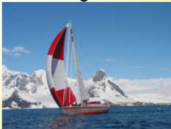
Zeilen rond Antarctica

Clubblad van de watersport vereniging "de Nieuwe Waterweg"