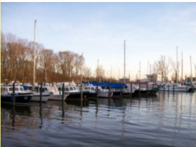
Schippers..... Wordt wakker de lente komt eraan!!!!!!!

Strijensestraat 62a • 3114 PW Schiedam • Tel. 010 4262761