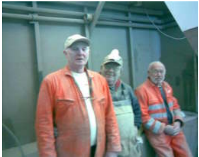
Zomaar op een zaterdagmiddag de mannen aan het werk.