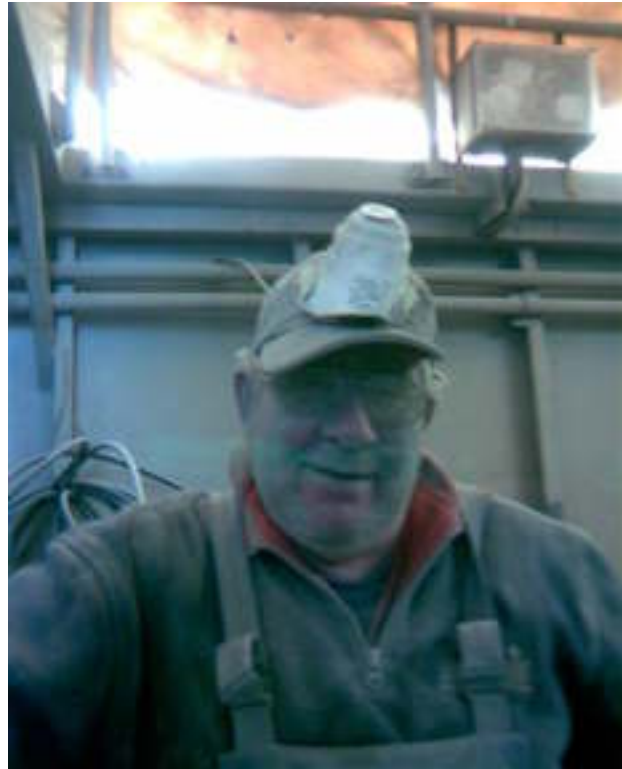
Koop'n een boot.....en werk je doooooood....