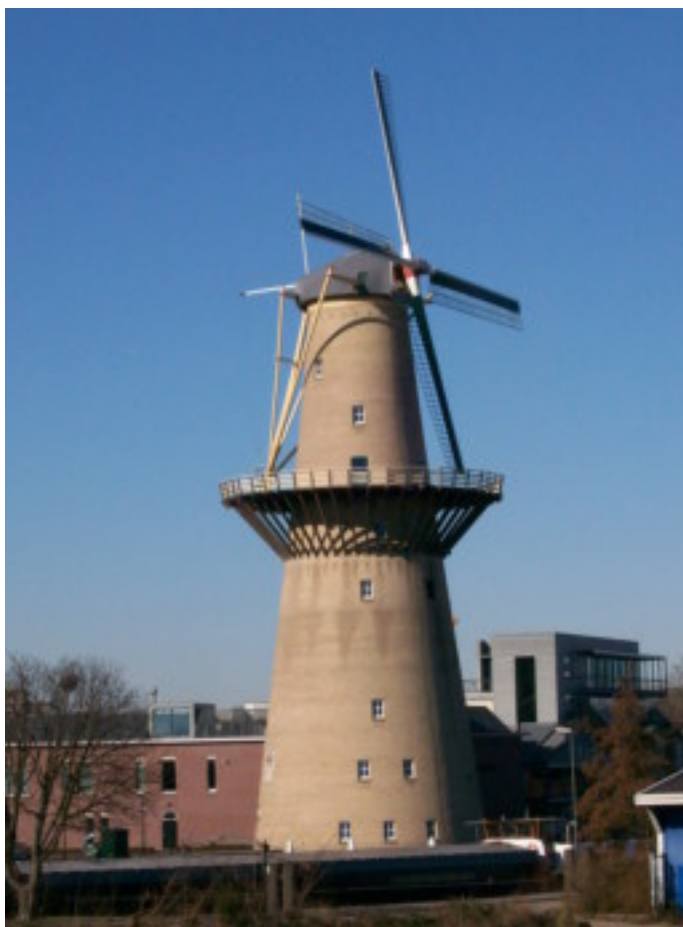
Windmolen van Nolet Schiedam

Van het terug naar het oude ambachtelijk gestookte Ketel 1 en voorzichtig daarna de Ketel Wodka One. Voor de export naar de Verenigde Staten. Al zijn ze daar maar een druppel van de enorme wodka-plas die daar gedronken wordt en het proberen om daar twee druppels van te maken. Dan een korte film. "Generations". Voor de Amerikanen heel veel historie voor ons een herkenning van heel wat oude plekjes in Nederland. Het bruggetje in Delft. De toren aan de haven van Hoorn. Zelfs iets van Medemblik zagen we voorbij schuiven. En veel uit Schiedam. De Lange Haven met de Korenbeurs en het Zakkendragershuisje. Dan was eindelijk de distilleerderij zelf aan de beurt. We begonnen uiteraard met stookketel no 1. Een mooie koperen ketel met helm. Daaromheen een stenen oven met hout gestookt. In deze ketel wordt de Ketel 1 gestookt. Jammer voor ons was de oven dit keer niet in werking. Er zaten wat barstjes in het stenen omhulsel en dat moest eerst gerepareerd worden.