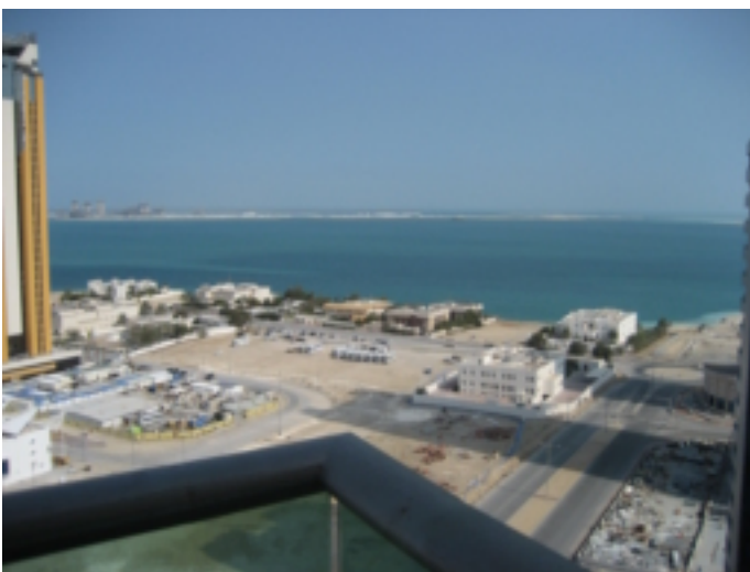
Mooi zo'n uitzicht op de nieuwe in aanbouw zijnde haven van de Royal Yachtclub van Doha