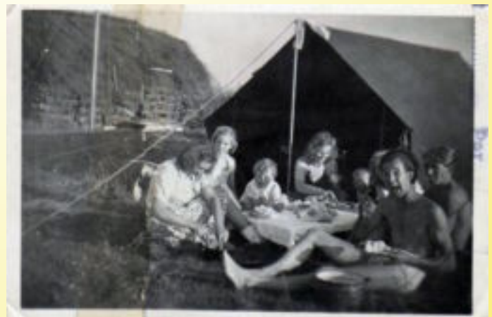
Heerlijk , zo vrolijk met weinig...