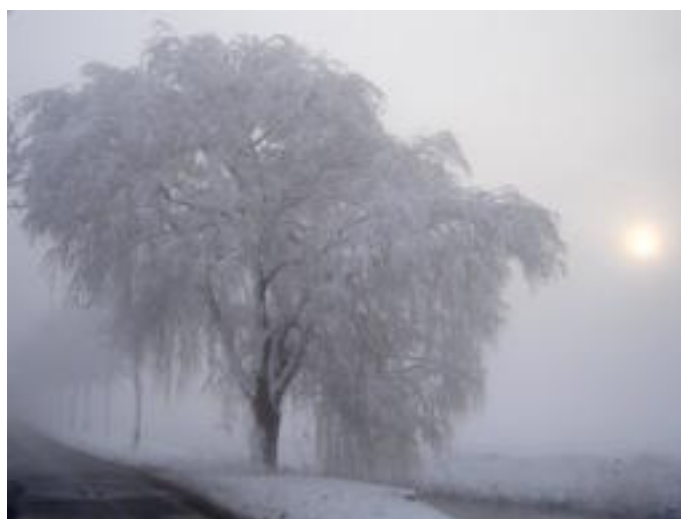
Aprilletje zoet geeft nog wel eens een witte hoed.

Medio maart 2008 zijn de Spuihavenverenigingen gestart met de opzet voor realisatie van een gemeenschappelijke losinstallatie toiletwater, die volgens de wet per 1-1-2009 gerealiseerd dient te zijn. De opzet betreft plaats van de losinstallatie, benodigde investeringen (in vloten, vingerpier, palen, equipment, aansluiting op het riool), budget, beheer en verantwoordelijkheid van de installatie, mogelijke subsidiebronnen en het beheerscontract tussen de verenigingen dat door de gemeente Schiedam dient te worden goedgekeurd.