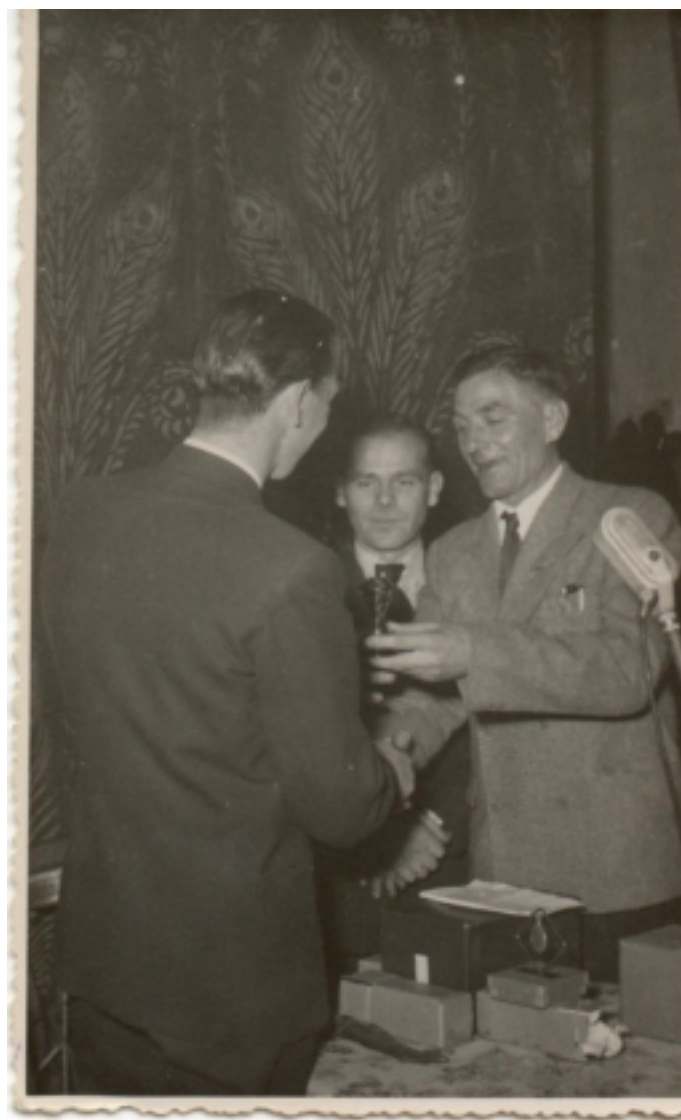
Wie weet nog wie dit zijn en wanneer deze prijs werd uitgereikt.

Nog even ter afsluiting, "Het plaatje rechtsboven is de haven van.....?"