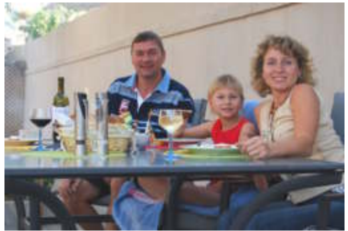
Lachende gezichten, rijk gevulde tafel.