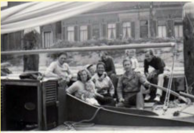
Wie zijn dat ??? Deze watersport pioniers

Strijensestraat 62a • 3114 PW Schiedam • Tel. 010 4262761