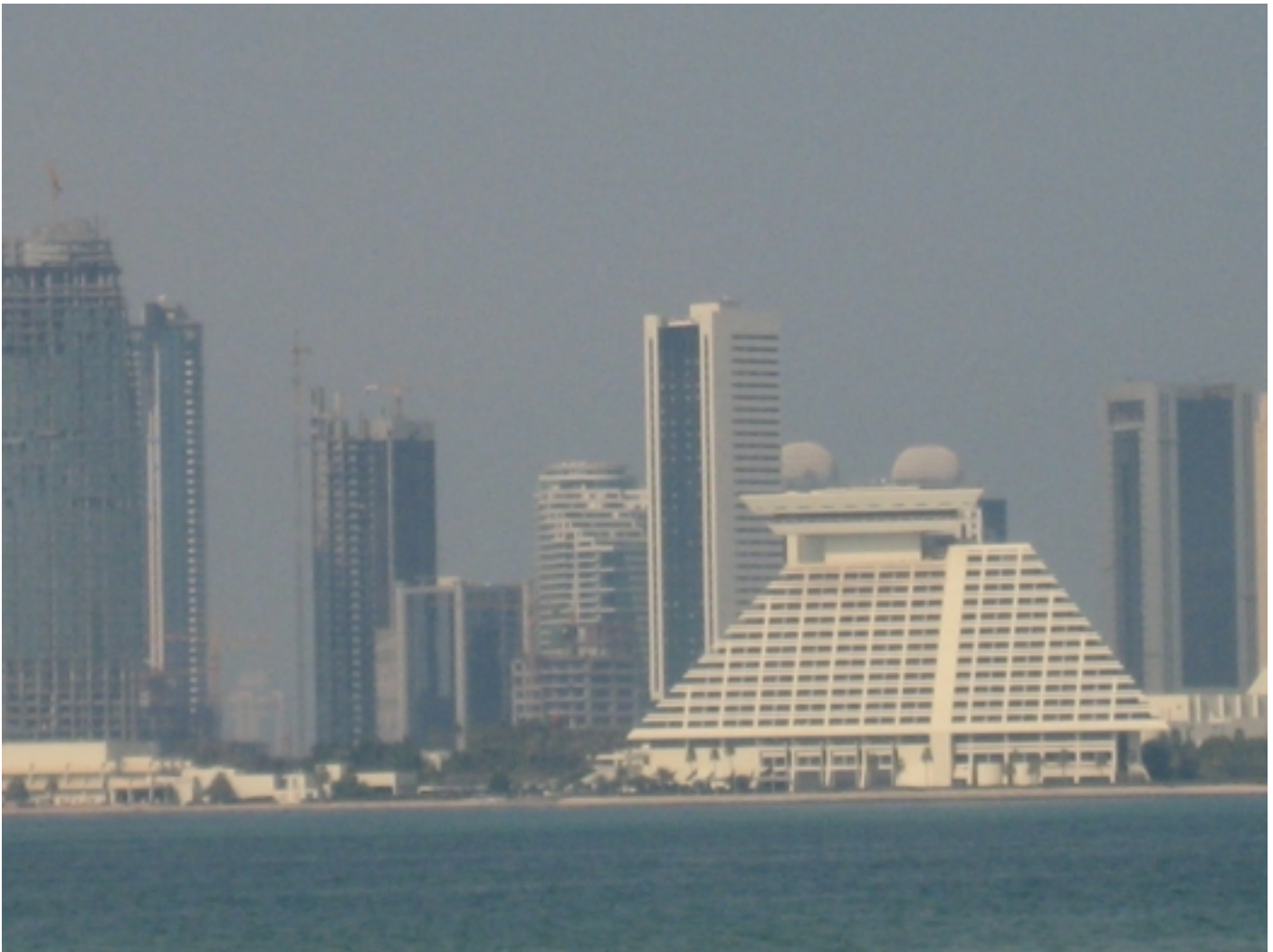
Het moderne aanzien van de stad ....D O H A ....in Qatar