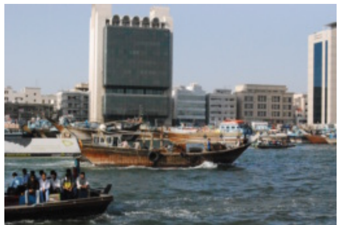
Oud en nieuw op één foto.