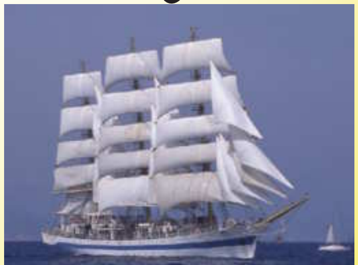
Nieuw lid aangemeld, moeten we toch de haven uitbaggeren. ?!!!!

Clubblad van de watersport vereniging "de Nieuwe Waterweg"