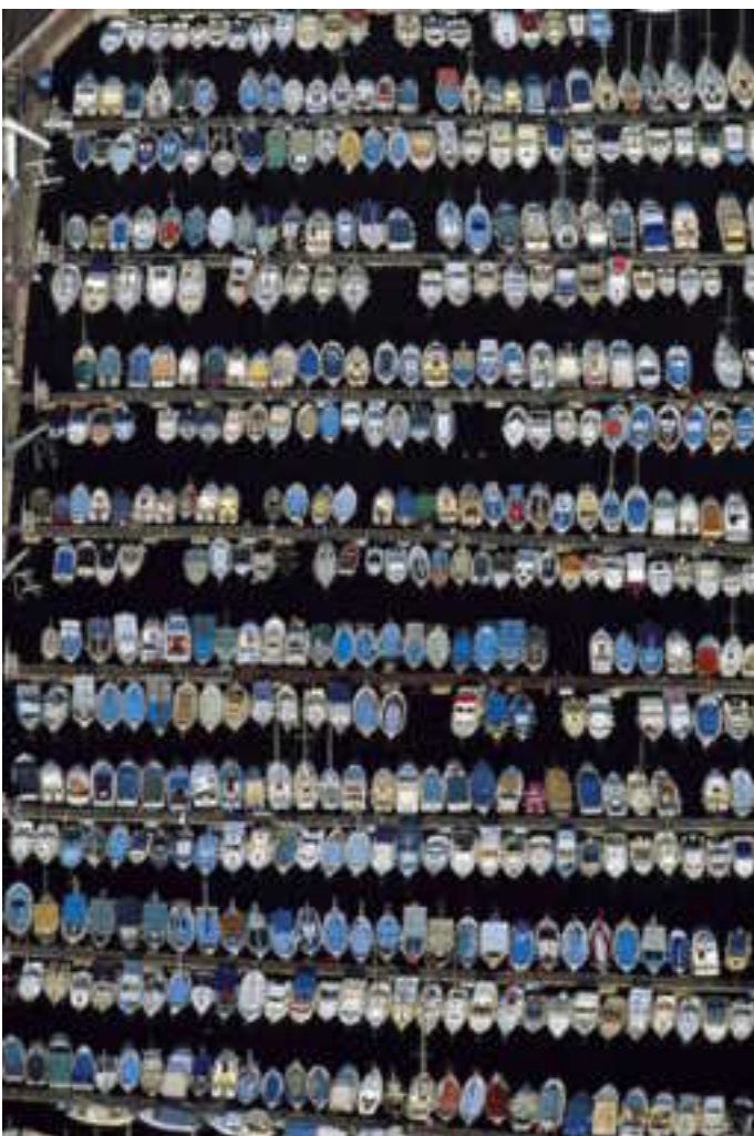
De Spuihaven na de herindeing ?????

Het bestuur is volgens een zeer oude afspraak (in een algemene vergadering?) bevoegd tot het zelfstandig aangaan van verplichtingen tot maximaal f 5.000 ( ca. € 2250). Dat mandaat is bij beste weten nooit vastgelegd, is weleens in een algemene vergadering aan de orde gekomen en is vervolgens een eigen leven gaan leiden. Besloten wordt om in de voorjaarsvergadering 2008 voor te stellen dit mandaat, gelet op de inflatie in de afgelopen 20 jaar, te verhogen tot € 5000 (met periodieke inflatieaanpassing) en in het huishoudelijk reglement vast te leggen.