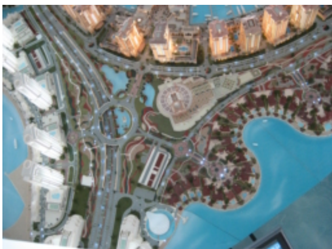
Alles is groot in DOHA, zelfs deze maquette van de jachthaven. Wat zou daar een ligplaats kosten voor een yacht van 40 meter????