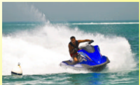
Een geweldige KICK

Clubblad van de watersport vereniging "de Nieuwe Waterweg"