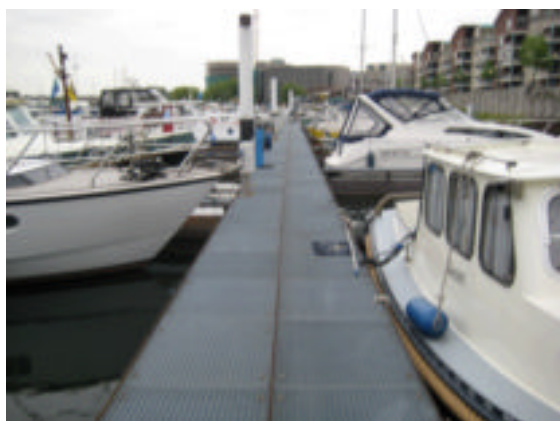
Ook in Roermond metalen roosters als vlotbedekking. Ideeje..?

Een aannemingsbedrijf is op dit moment bezig een prachtig douche gebouw neer te zetten met een groot aantal douches, wc's en wasbakken met warm en koud stromend water. De cijfercode sloten zitten er nog niet op maar wij genieten de primeur als eerste gast-doucheurs. Lekker lang en grateloos... De gemeente betaalt. Jammer dat het zo ver weg is, anders gingen we hier ieder weekend naartoe.