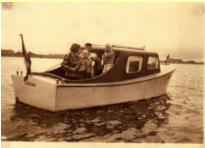
De "DOEA" de zelf gemaakte motorboot van mijn ouders is 1948

We dachten dat BOX 29 met motorjacht De Stormvogel van André en Sonja v. Tooren wel bereid zouden zijn hun belevenissen voor het volgende clubblad op te schrijven. Deadline 3 oktober 2009 !!!!!