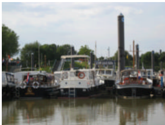
*) Prachtige-Penis-Palen haven. Links de Noordgeul en rechts de Ragnar.

Een laatste herinnering aan WSV De Maas in de PPP-haven *) in Venlo.