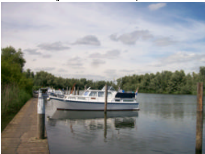
De "Encore" wat lijkt op de namen van ons AnnCor, maar is een frans woord voor ..alsnog..