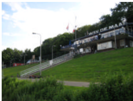
Enorme aluminium loopbruggen

Wat een gemeenteraad. Het schitterende clubhuis is tevens een prima restaurant en verpacht. De prijzen zijn zeer redelijk en de vereniging krijgt ieder jaar, na inzage van de jaarrekening een percentage van de winst. Een prachtig havenkantoor met verschillende havenmeesters; ook hier doet men dat op toerbeurt .