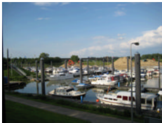
En zo staan er een heleboel...

of wordt aan hun voorzieningen besteed. Een enorm terrein op de kant waar iedereen 's winters kan staan, met een grote Romney loods, voor het gereedschap en de binnenklussers.