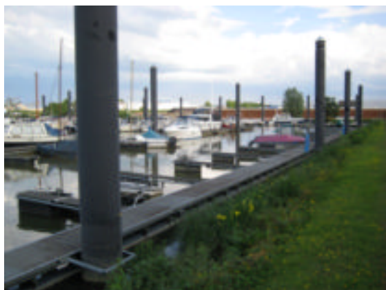
Metalen roosters op de vloten

Zo moet de watersporthemel eruit zien... Zelfs de steigers van de kleine bootjes hebben vingerlingen en ook hier in Venlo is men net als in Roermond van de zware houten beplanking overgestapt op metalen roosters op de vloten. Geen losliggende of holle of opgebolde planken meer. Minder zwaar dus, trekvrij en geen eendenstront. En naaldhakken...? Die doe je niet aan als je gaat varen dames.