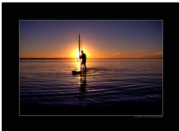
Zonsondergang na weer een mooie zomerdag