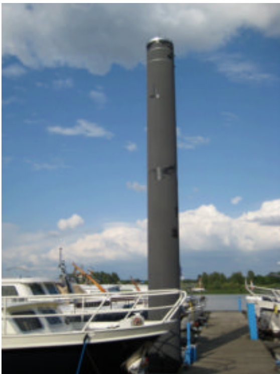
Palen 75 cm dik

In Venlo heeft men niet alleen de mooiste jachthaven van Nederland maar ook de goedkoopste. En simpel. De kosten? Lengte 9.80 mtr. kost E 9.80. Klaar. En toeristenbelasting...? Wat is dat? Elektriciteit en water gratis en de douches zijn prachtig, gratis en zo lang als je wilt. De vloten liggen vast aan enorme stalen palen van zo'n 17 meter lang en 75 cm. dia.