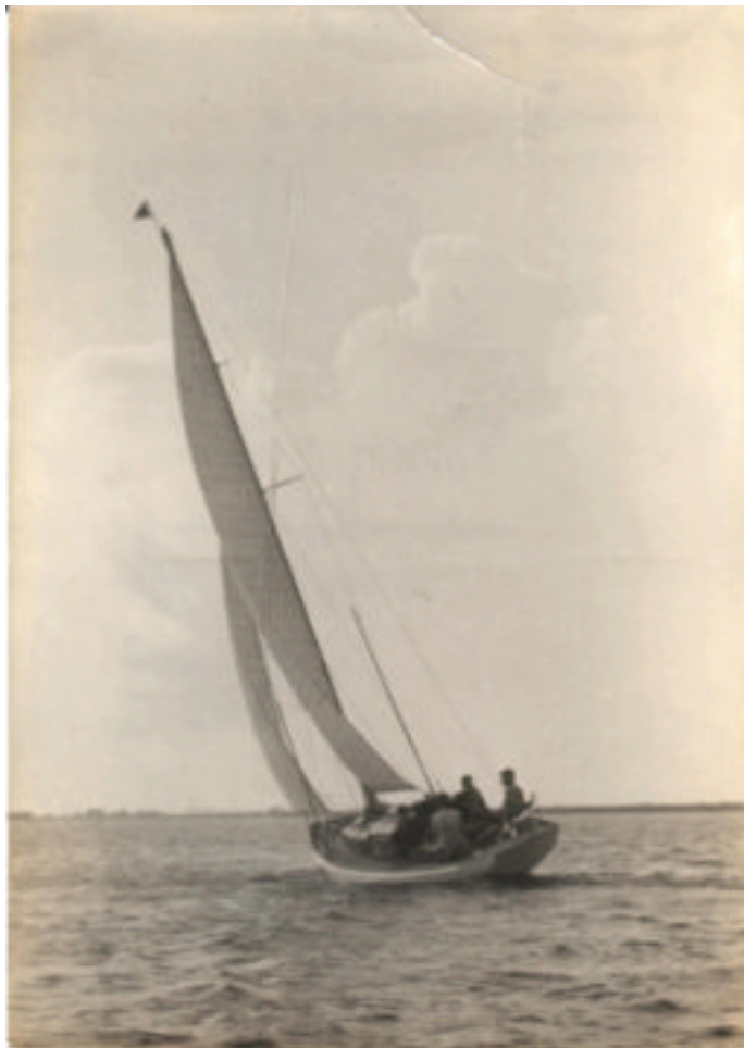
De zeilboot "Alwater" waar ik als jongen in opgegroeid ben.