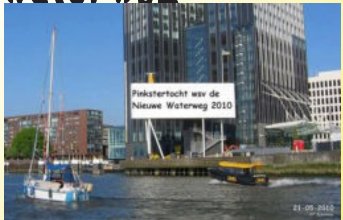
Zelfs op de oevers van de Nieuwe Maas in Rotterdam had de commissie gezorgd voor een groot publicatiebord. Iedereen mocht weten dat we een clubtocht gingen houden.

Clubblad van de watersport vereniging "de Nieuwe Waterweg"