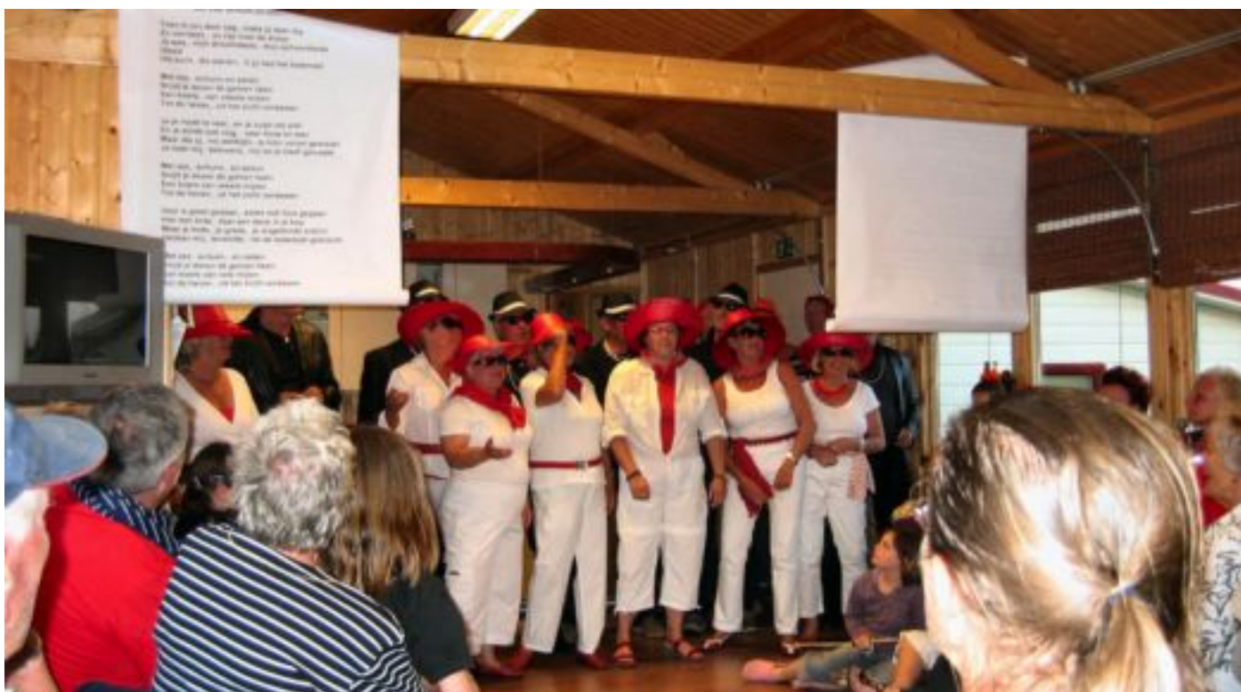
Het eerste optreden op zaterdagavond blijkt achteraf al het winnende team te zijn van het Piksterweekend.

Adm. Helfrichweg 4 | 2901 AB | Capelle a/d IJssel