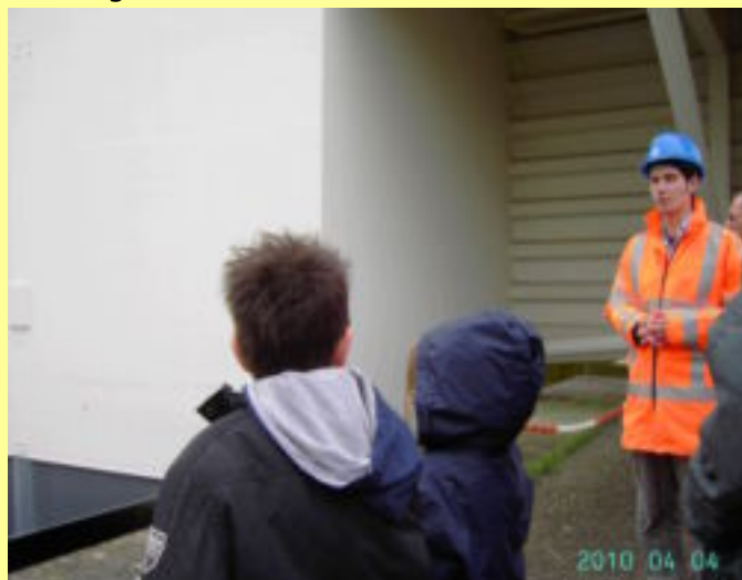
Leuke knul die Gids

Terug in het clubhuis was de warme koffie of een warm makend drankje zeer welkom. Nou zeker voor herhaling vatbaar.